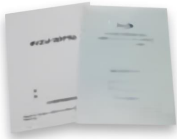
JOPHダイエットアドバイザー

※ テキストは、WEB閲覧用は認定試験受験お申込みの際に送付。 (紙媒体ご希望の場合は別途有料となります)