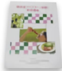
美肌食マイスター初級